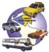
CUADRO N° 07 INDEMNIZACIÓN POR TIPO DE VEHICULO 2019